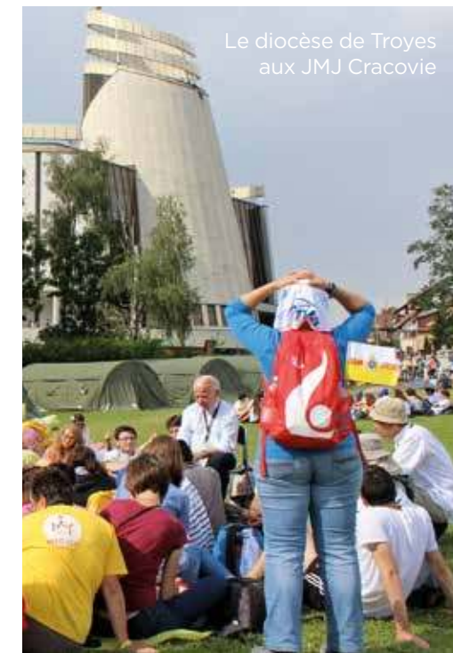
Le diocèse de Troyes aux JMJ Cracovie