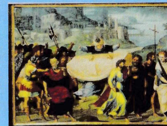
Le portement de la Vierge The carrying of the Virgin