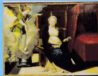
Annunciation de la mort de la Vierge The annunciation of the dead of the Virgin